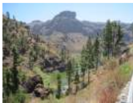
Soria - Las Niñas 70 km / 21 km / 5,5 h