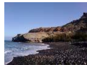
Mogán - Veneguera 37 km / 4,5 h / 3,0 h