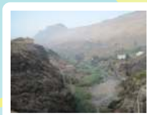
Ayagaures - Arteara 42 km / 6,0 h / 3,5 h